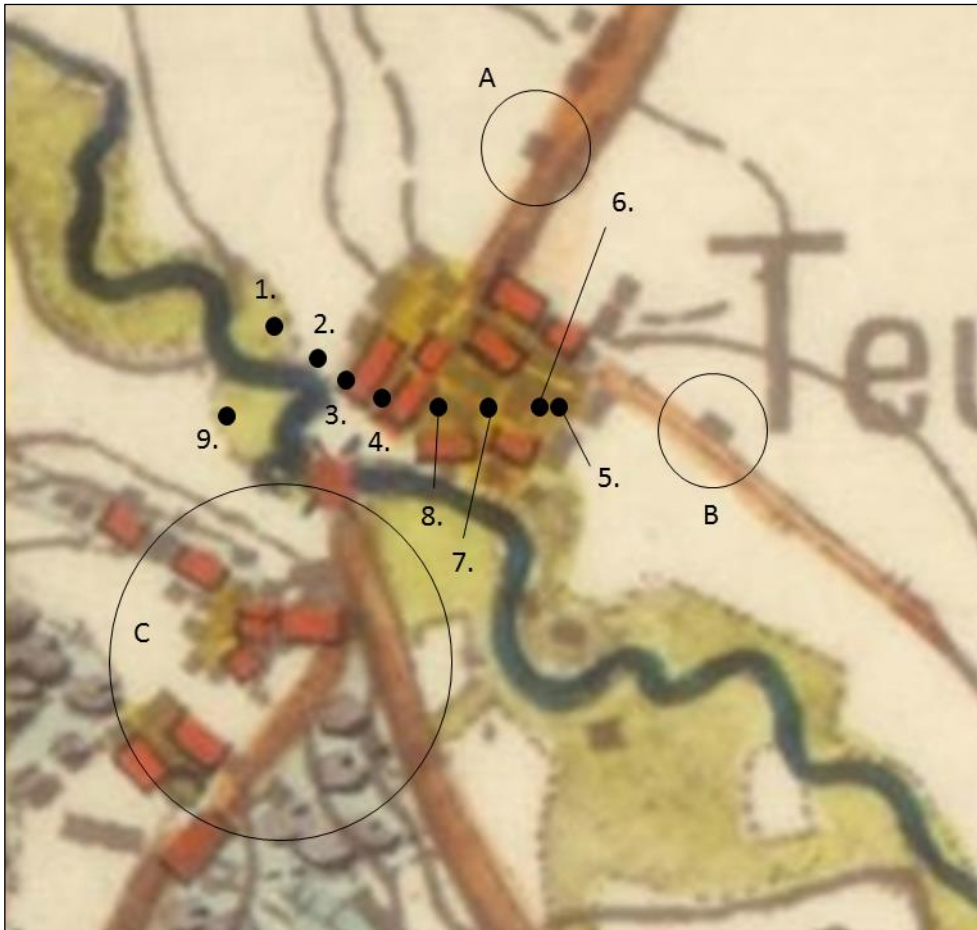
Vuoden 1884 topografinen kartta. Tämän valvonnan havainnot mustilla pisteillä merkittyinä ja muut huomiot ympyröitynä. Havaintojen sijainnit on arvioitu silmämääräisesti, karttaa asemoimatta.

Havainto 1: Pellon reunalla: Palon jäljet todennäköisesti muulta ajalta.