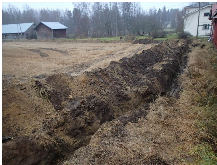
Lounaaseen. Näkymä osuuden 8 päästä.

Linja poikkesi lausunnon kartasta, mutta se valvottiin, koska se kulki ryhmäkylän tuntumassa, ja lähellä jokea. Osuus kaivettiin pellon reunaan samansuuntaisesti aikaisemmin asennetun puhe-linkkaapelin kanssa. Osuuden maat olivat puhdasta pohjamaata ja peltomultaa, sekä näistä sekoittuneita maita. Mitään muinaisjäännöksiin viittaavaa ei havaittu.