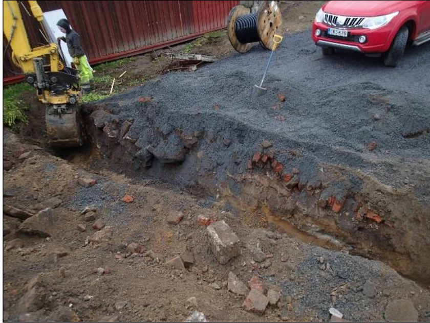
Havainto 5 , (N 6751581 E 333371). Pohjoiseen. 1900-lukulaisen saunan tiiliset ja kiviset jäänteet erottuvat kuvassa oikeasta reunasta kauhalle asti.

Hieman saunan jäänteiltä luoteeseen päin, tallirakennuksen etelänurkan edustalta, esiintyi palojälkiä muokkauskerrosten alla ( Havainto 6 ). Siinä havaittiin n. 4 m matkalla osaksi palaneita puuroskia, hiiliä, hajallaan olevia pienehköjä nokisia kiviä, joista osa oli rapautuneita. Kerrostu- massa esiintyi myös harvoja tiilen paloja ja laastia. Kivien lomasta löytyi myös tunnistamaton rautalenkki. Kiinteistön asukas ei osannut sanoa, mihin jäänteet liittyvät. Pihan alueella kaivannon seinämissä näkyi myös paljon mustuneita kerroksia, joissa esiintyi tiilenpaloja. Sekä eräällä kohtaa myös laikkumaisena esiintyvää palomaata, kaivannon pohjalla ( Havainto 7 ).