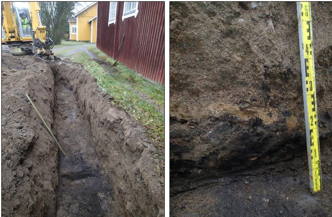
Havainto 6 , (N 6751581 E 333361). Vasemmalla: Luoteeseen. Latan edustalla näkyy esiin puhdistettua palokerrosta. Se jatkui kuitenkin n. 4 m siitä kaivinkoneelle päin. Oikealla: Palokerros alkaa n. 80 cm syvyydeltä, muokkauskerrosten alta. Se on yläosastaan sekoittunut puhtaaseen hiekkaan, ja on siltä osin irtainta. Kaivannon pohjalla kerros on melko kovaa.