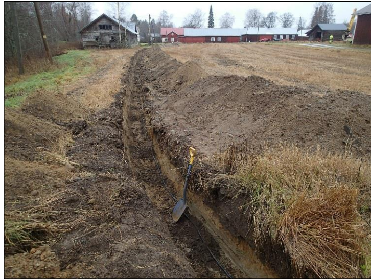
Luoteeseen. Näkymä osuuden 7 päästä.