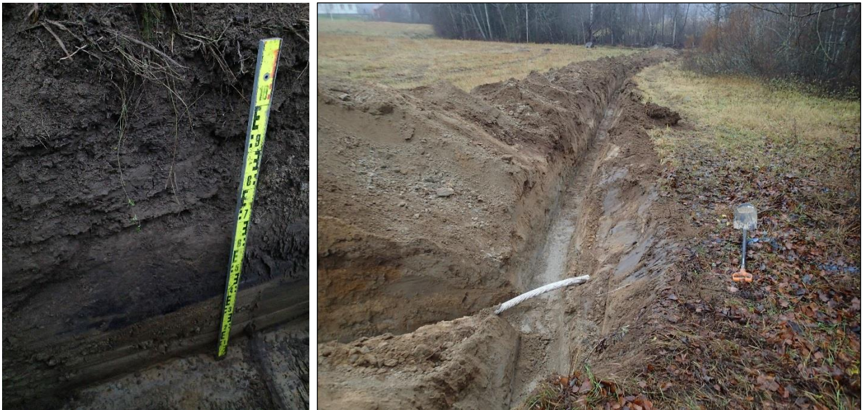
Vasemmalla: Havainto 9. Oikealla: Pohjoiseen. Näkymä Osuuden 11 eteläpäätä.

Osuudella kaivettiin hieman eri suunnassa kuin jotta sen kaivu valvottiin. Osuus alkoi joen penkalta, jossa esiintyi ainoastaan luontaisia maita. Joen penkan viereiselle pellon reunalle oli tuotu maata. Kohdassa, jossa tuotu maa alkoi, esiintyi luontaisen pohjamaan ja täyttökerroksen välissä n. 20 cm paksu ja n. 1 m leveä nokijälki ojan itäseinämässä ( Havainto 9 ). Muutoin osuuden kaivettu maa oli löydötöntä kyntökerrosta, sekä sen alaista puhdasta hietaa.